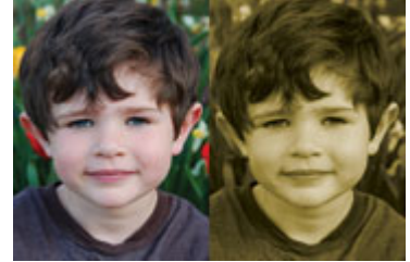
Arriba: Su visión puede opacarse o tornarse amarillenta cuando hay cataratas.

La mayoría de cataratas relacionadas con la progresión de la edad, se desarrollan gradualmente. Como resultado, es posible que no se perciban de inmediato los cambios en la visión o las señales de cataratas en su estado temprano de desarrollo.