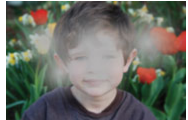
Arriba: Una visión borrosa o tenue es un síntoma de cataratas.

Ver los colores brillantes atenuados o amarillentos.